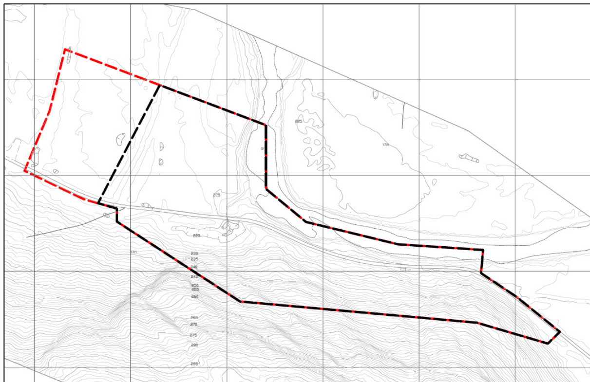
Figur 2. Kart som viser kunngjort planområde (rød stiplet strek) og planavgrensning i planforslaget – svart stiplet strek.

Planområdet består i hovedsak av eksisterende masseuttak og masselager, samt skogsareal, en skogsbilveg og grenser dels til elva Gjøv. Det er ingen bebyggelse innenfor planområdet. Nærmeste bolig ligger ca. 4-500 m fra uttaket. Denne er bebodd av tiltakshaver. Det er 3-500 meter til nærmeste eksisterende fritidsbolig og 800 – 1000 meter til regulerte tomter for fritidsbebyggelse i Høykallsåsen.