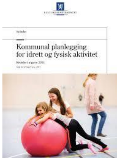
Bilde 1: Kulturdepartementets veileder for planlegging for idrett og fysisk aktivitet

Det er ifølge veilederen en rekke minstekrav til planens innhold. Nærværende plan imøtekommer disse krav.